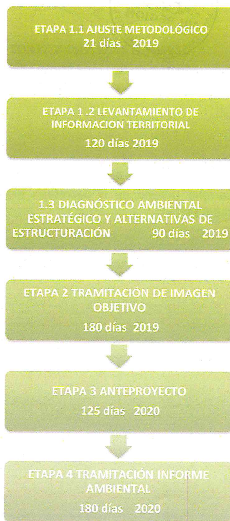
Figura 3: Cronograma Estudio Plan Regulador Intercomunal de Cauquenes

El cronograma estimativo para la elaboración del Plan Regulador Intercomunal es el siguiente: